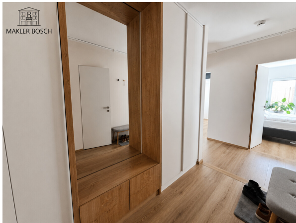
Eingangsbereich - Einbauschränk