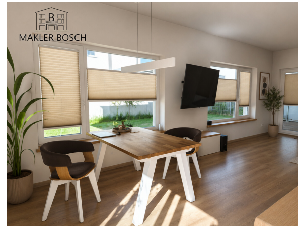
Ess - Wohnbereich