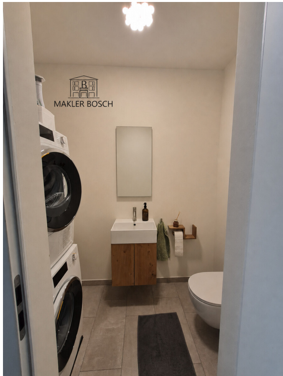
Gäste - WC